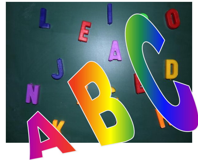
Hilfen beim Lese- und Schreiberwerb