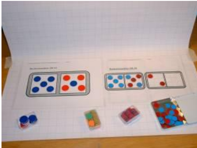
Beratung und Einsatz von didaktischen Materialien

Durch rechtzeitige Intervention soll das Entstehen von sonderpädagogischem Förderbedarf verhindert werden.